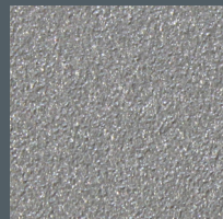
9007 Metallic Feinstruktur (FS)