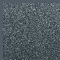
Anthrazit, Feinstruktur (FS) – ähnlich RAL 7016

Mit unseren vier beliebten Farbvarianten ohne Mehrpreis kann Ihr neuer Sommergarten auch farblich an die Gestaltung Ihres Hauses angepasst werden.