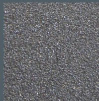
DB703 Metallic Feinstruktur (FS)